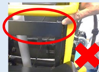
背スライドフレーム