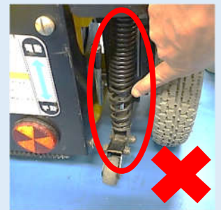
サスペンション本体