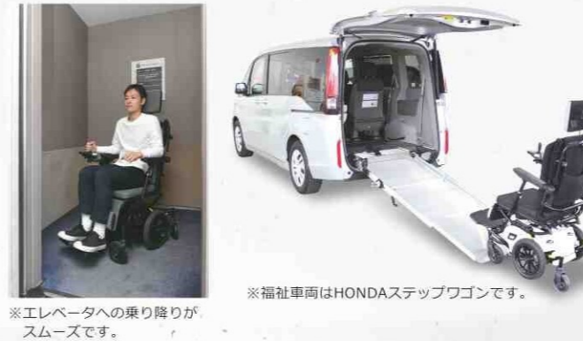
※エレベータへの乗り降りがスムーズです。